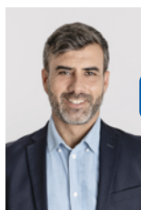
Photo conforme :